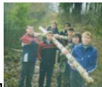
Встановлення пам'ятного хреста на могилі (2018)

На Свято Покрови на впорядкованих нами могилах із встановленими хрестами відбулись поминальні заходи. Місцевий священник освятив ці місця та відслужив поминальну панахиду.