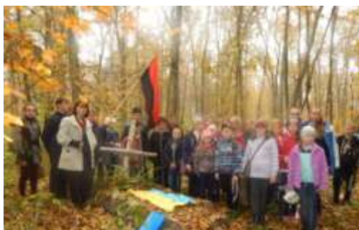
Освячення могил біля «Пітомніка» місцевим священником на Свято Покрови 2019 року

На Свято Покрови на впорядкованих нами могилах із встановленими хрестами відбулись поминальні заходи. Місцевий священник освятив ці місця та відслужив поминальну панахиду.